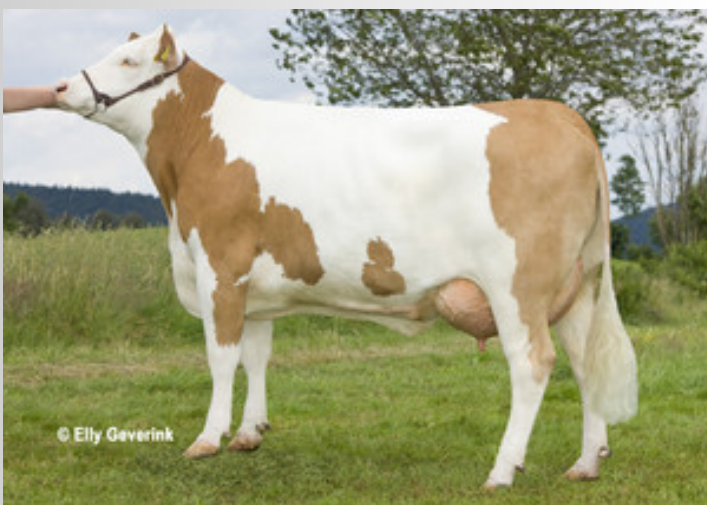
Waban-Elma (Zü: Häfler, Julbach)

Waban wurde aus der bekannten G-Linie des Betriebes Sigl, Steinbach gezüchtet. Der Linie entstammen bereits einige Stiere wie auch Zanetti, der Vollbruder von Gisella, der Mutter von Waban. Waban ist das gelungene Resultat einer Kombination des Spitzen-Leistungsvererbers Wille mit dem fitnessstarken Zahner. Wie sein Vater kann Waban mit einer enormen Milchmenge bei überdurchschnittlichen Eiweißprozenten gepaart mit einer guten Fitness überzeugen. Hier gefallen besonders die Persistenz, Nutzungsdauer und Zellzahl. Waban eignet sich hervorragend auf exterieurstarke Tiere und kann selbst mit extrem hohen Trachten, einem schönen Schenkeleuter und optimal ausgeprägten Strichen punkten. Die Sprunggelenkwinkelung, sowie die Voreuterlänge sind bei der Anpaarung zu beachten.